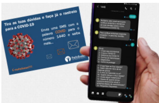
L'équipe de Pathfinder au Mozambique a adapté son programme mCenas à COVID-19, permettant aux utilisateurs de s'auto-dépister et d'obtenir un traitement.

À partir du début de 2020, la nécessité de contenir la pandémie de COVID-19 a contraint les activités et les services de nombreux pays à cesser totalement ou partiellement leurs activités ou à se